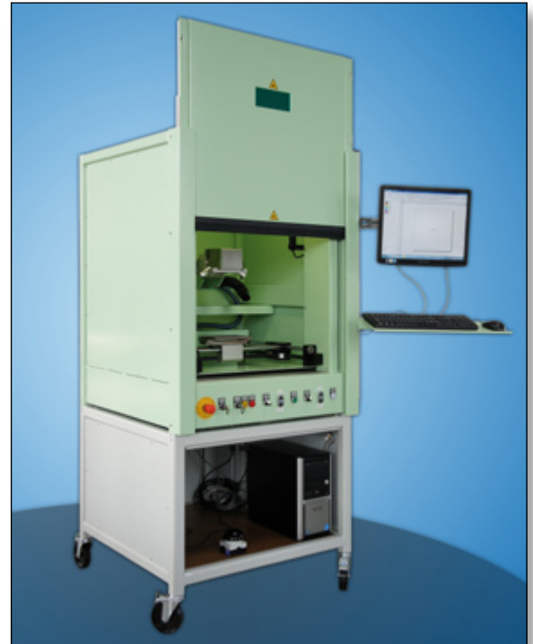
Protec FL wurde speziell für die sichere Automation von Laseranwendungen entwickelt