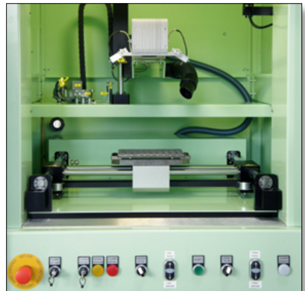
Bedienelemente an der Gerätefront bieten Zugriff auf alle Maschinenfunktionen